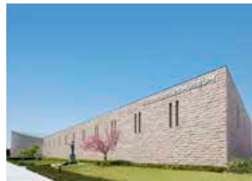
安藤百福発明記念館 大阪池田

1999年、インスタントラーメン発祥の地・大阪府池田市に、2011年には横浜市みなとみらいに、体験型食育ミュージアム「安藤百福発明記念館（愛称：カップヌードルミュージアム）」を開館し、インスタントラーメンの歴史を通じて、「発明・発見の大切さ」や「クリエイティブシンキング=創造的思考」など世界の食文化に革新をもたらした安藤百福の思いや考えを伝えています。