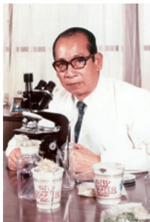
安藤百福 あんどう ももふく (1910~2007)